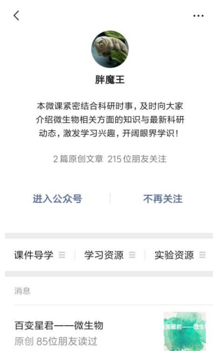
图3 微信公众号概况