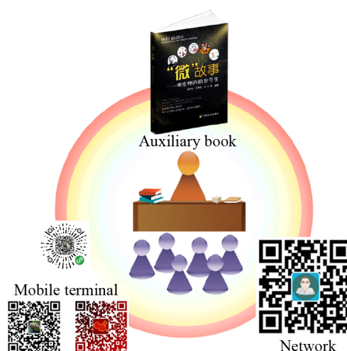
图 1 “教辅书籍、网、端”一体化微生物类课程拓展资源体系

微生物类课程受属性特点、学科专业要求、学习对象素养及知识架构等影响,想要建设具备普适性、宽口径的优质教辅书籍不易,需要同时满足多项要求:(1) 切实发挥辅助作用;(2) 兼顾不同学科专业,传统经典与当代进展相融合;(3) 有情有景、生动有趣、通俗易懂;(4) 提高科学素质的同时,兼顾培养爱国情操、教育思想道德和树立理想抱负。我们组织二十余位具有不同学科和职业背景的师生、科研人员及企业人士,耗时 3 年编著《“微”故事——微生物的前世今生》一书。全书共分 7 篇(吾名微生物;微生物学大咖;饮食中的门道;可怖的微生物;微生物与农业;微生物与环境;脑洞大开),包含 67 个故事,寓教于乐、情景结合,颇具可读性;既有“列文虎克的显微镜”这样的经典知识点,又有“紫色细菌,第一个被发现的外星生物?”