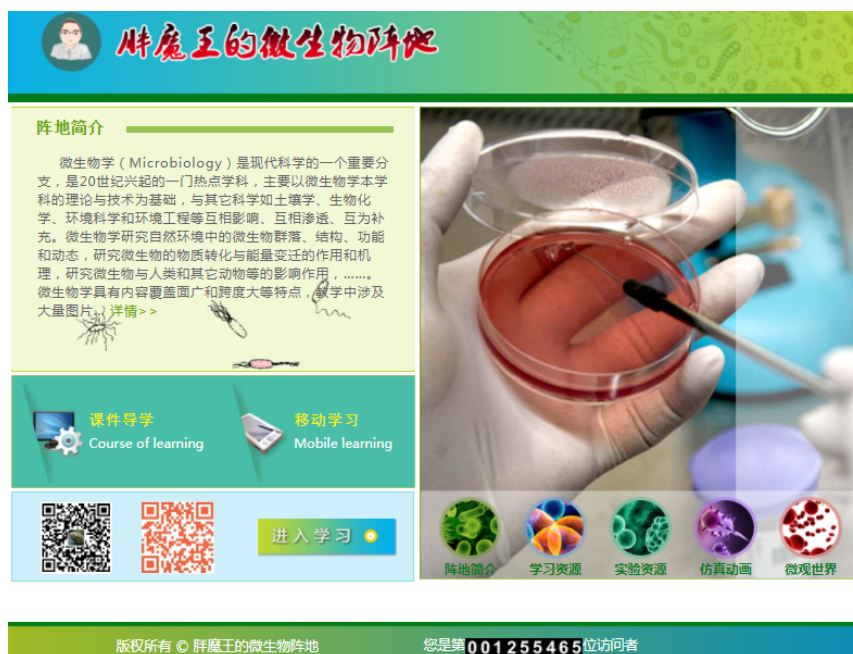
图 2 “胖魔王的微生物阵地”网站首页

网络普及和移动技术的快速发展使得移动终端成为了新型学习工具, 便携与可进行碎片化学习是其突出特质。其中, 最具代表性的当属微信公众平台, 相关微生物类教学应用实践也已见若干报道 [7-9] 。我们于 2013 年底开通微信公众号, 并将其融于微生物日常教学之中。目前, 该公众号能实现“胖魔王的微生物阵地”网站绝大多数学习功能, 推送功能更是彰显便捷, 关注人员 2 650 人, 遍布我国第一级行政区划省市和自治区(图 3), 在法国、美国和加拿大等国也有分布。从五年多的应用情况来看, 该平台起到了良好的教辅作用, 并因其具备扩散性还可当作科普利器, 每年仅推送部分阅读量就超 4 万次, 已具备一定辐射力度。