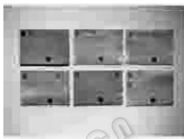
图 1 1-6 株分枝杆菌标准株结果

针分布从左至右, 从上到下顺序依次为探针 pMyc、pTub、pAvi、pInt、pKan、pAbs、pScr、pGas、pFor、pChe、pMal、pSim、pGor、pSzu、pMal、pXen、pFla、pTer、pSme、pNon、pPhl。上述探针只和相应菌种杂交, 探针 pFor 与海分枝杆菌标准株扩增产物发生交叉杂交, 但探针 pMar 与偶然分枝杆菌扩增产物无杂交, 因此并不影响对鉴定结果的判读。杂交结果见图 1-4。8 种其它细菌中的甲型溶血性链球菌和假白喉棒状杆菌标准株与 pMyc 分枝杆菌探针无杂交。