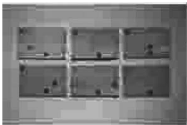
图 3 13–18 株分枝杆菌标准株结果

杆菌 2 株, 偶然分枝杆菌 1 株, 2 株只与 pMyc 属探针杂交鉴定为分枝杆菌属。