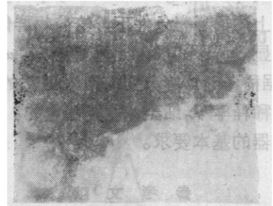
图 1 I 型单纯疱疹病毒电子显微镜照片(60000×)

本实验所纯化的 HSV-I 经电镜检查, 呈单一病毒颗粒, 无细胞碎片及细胞器存在(图 1), 表明我们所用的病毒样品是高度纯化的。