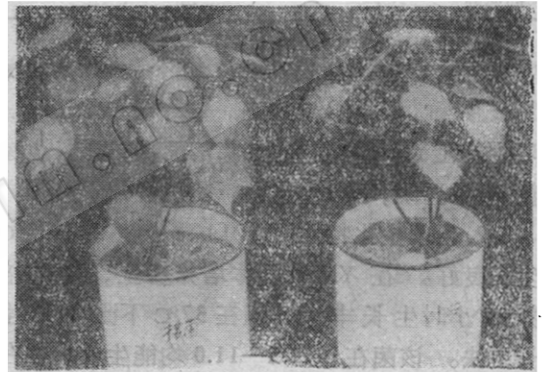
图 1 接种 8214 菌液对棉花苗期生长的影响