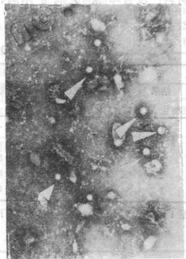
图3 病变细胞培养液中分离到与原始病毒形态相同的病毒粒子(未浓缩提纯),69000×

本试验用电镜观察病变细胞培养液(包括毒种传代的病变细胞培养液)证明其中存在有与原始病毒形态相同的病毒粒子。病变细胞培养液添食感染健康菜白蝶幼虫时,导致幼虫罹病死亡,从虫尸中又能分离到相同的病毒粒子。由此证明菜白蝶非包涵体病毒对BHKp925上皮细胞引起的细胞病变作用是有特异性的。这一试验的成功不仅说明该病毒不宜用作杀虫剂,同时对其他已作为杀虫剂的昆虫病毒对人畜的安全效果应予以严格的检查和评价。