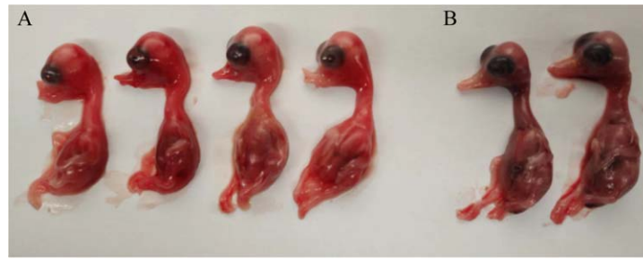
图1 NDPV感染SPF鸭胚后病变图 A: NDPV感染SPF鸭胚(120 h); B: 正常SPF鸭胚。

Figure 1 Image of NDPV infected SPF duck embryo. A: NDPV infected SPF duck embryo (120 h); B: Normal SPF duck embryo.