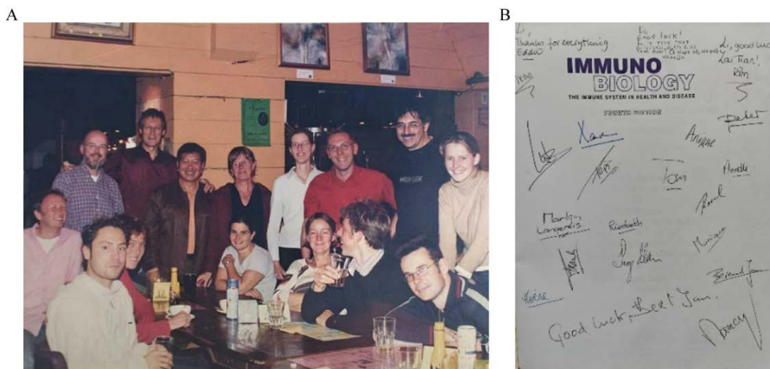
图1 在荷兰实验室学习期间的留念 A: 2005年1月乌特勒支大学兽医学院病毒学实验室合影。B: 同事赠送的专业书扉页签名留念

印象深刻的还有乌特勒支大学博物馆。乌特勒支大学有近400年的历史,名人荟萃;博物馆建有多个展厅,许多具有悠久历史的文献资料、教学用品、标本、仪器设备被陈列在馆内,参观者可以自己设计实验,亲自操作一些实验器材,体验一些科学实验过程。悠久的历史和文化是社会发 展积淀的重要组成部分,因此博物馆特殊的体验感受体现了独特的大学文化传承,很有意义。