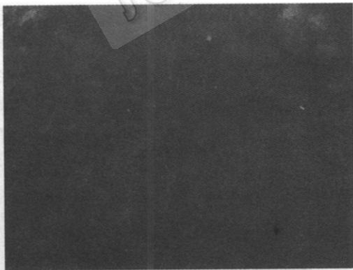
图3 菌丝显微照片 (×640)

从菌丝形态而言, span-20 使菌丝生长减缓, 形成短、粗且分支少的分散型菌丝体 (见图 3, 图 4)。在 span-20 添加量合适的条件下, 这种菌丝形态大大提高了三孢布拉氏