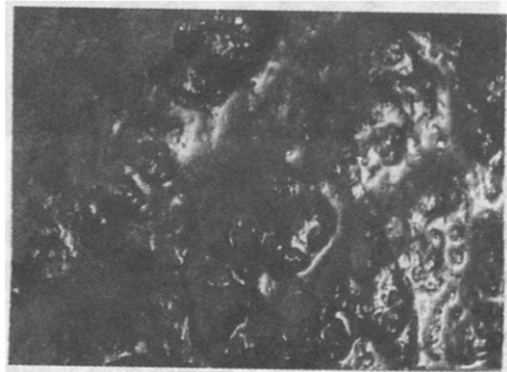
图2 添加煤油菌体形态

当在发酵液中添加合适的表面活性剂,不仅可以改善发酵液的流变特性和细胞通透性,而且,就霉菌来说,还可以形成均一、紧密的菌丝球。因此,我们选择了非离子型表面活性剂triton-X100,考察它对发酵的影响。其结果见表4。