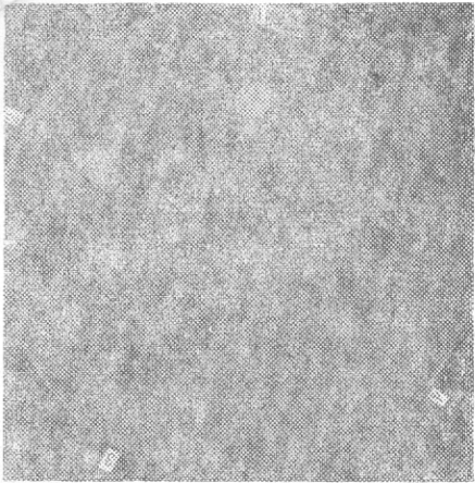
图 3 融合体在37℃培养后抗菌活性的测定 Fig.3 Detection of antibacterial activity of fusants at 37℃ incubation

培养后几乎难以生长完全丧失了抑菌活性的能力。热灰紫链霉菌 T 272 最适生长温度为45℃，但不产生任何抑菌活性。在