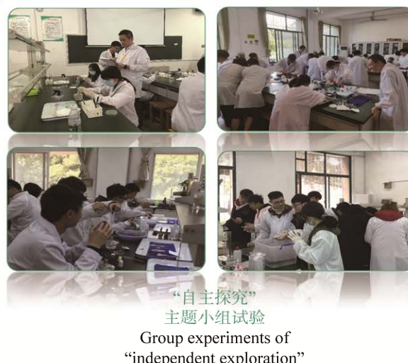
“自主探究” 主题小组试验 Group experiments of “independent exploration”