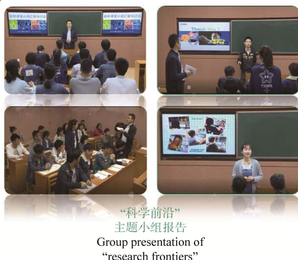
“科学前沿” 主题小组报告 Group presentation of “research frontiers”