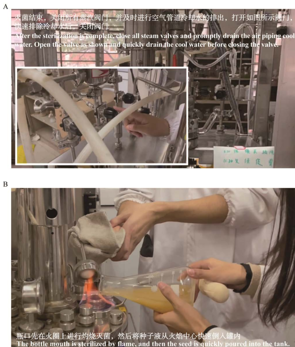
图 3 学生制作的视频截图 A：发酵培养基灭菌操作. B：火焰接种操作

Figure 3 Screenshot of video produced by students. A: Sterilization operation for fermentation medium. B: Flame inoculation operation.