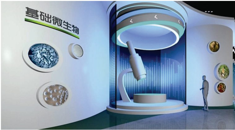
图 2 微生物学虚拟仿真实验平台展示区