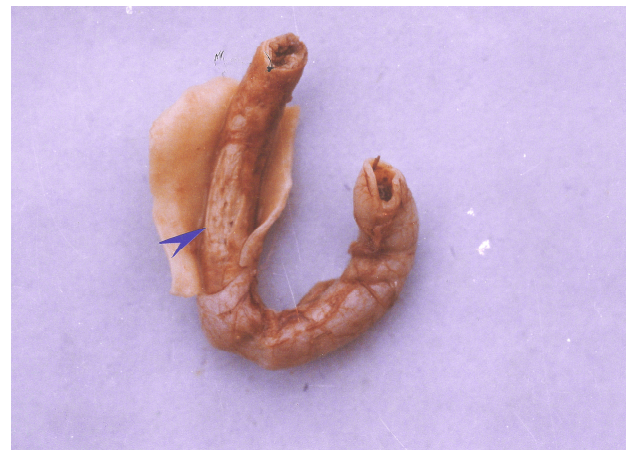
图2 患病雏鹅的小肠

Note: The photograph shows two typical morphologies of goose parvovirus, the complete viruses and viruses lacking of nucleic acid shell, in thin section electron microscopy.