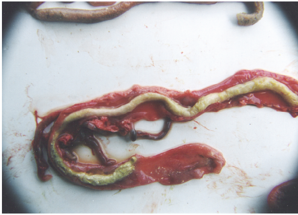
图3 患病雏鹅回盲段肠道