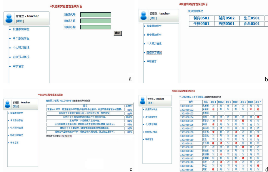
图3 教师管理网页实例