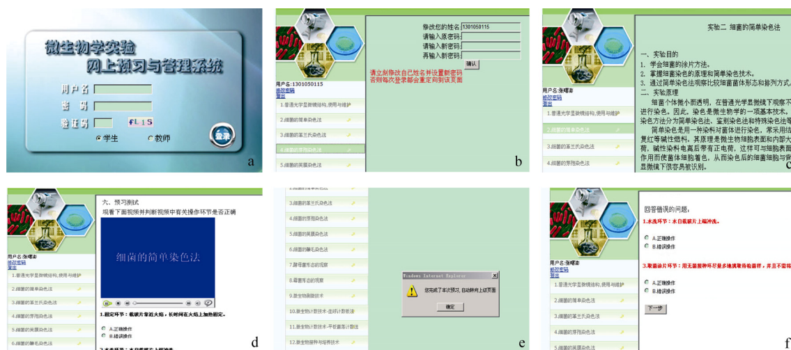
图2 学生预习网页实例