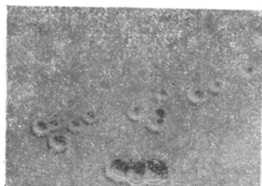
图3 碱产碱假单胞菌(示菌落凹陷形)