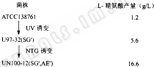
图 1 UN100-12 菌株的诱变谱系图

以谷氨酸棒杆菌 ATCC138761 为诱变出发菌株, 经紫外线 (UV) 诱变和磺胺胍 (SG) 平板筛选, 获得一株能产 L-精氨酸的菌株 U97-32, 对该菌株又进行亚硝基胍 (NTG) 诱变和精氨酸甲基酯 (AE) 平板筛选, 获得一株产 L-精氨酸能力有较大提高的突变株 UN100-12, 它是对药物磺胺胍和结构类似物精氨酸甲基酯具有显著抗性的突变株。UN100-12 菌株的诱变谱系如图 1 所示。